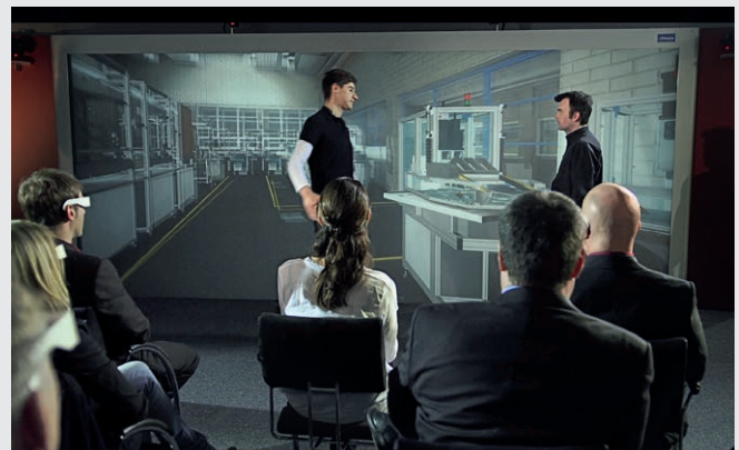
► Abb. 8: Entwicklung technischer Dienstleistungen im ServLab

Außerdem ist das Labor mit umfangreicher Software ausgestattet (z.B. Ideenmanagement, Prozessmodellierung), welche die Entwicklung der Dienstleistung unterstützt. Die gesamte Technik lässt sich über eine Pad-Lösung einfach bedienen. Das ServLab wird regelmäßig von Existenzgründern sowie kleinen und mittleren Unternehmen zur Entwicklung ihrer neuen Dienstleistungen genutzt.